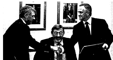
PLAN INTEGRAL DE MEJORA DE LA ACTIVIDAD ARBITRAL

Empresa de servicios que ceda los profesionales a las entidades deportivas