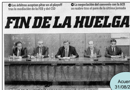
Mundo Deportivo, 19 de mayo de 2010